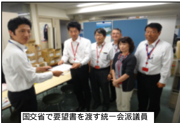
国交省で要望書を渡す統一会派議員

国民の立場で真実を伝え続ける しんぶん赤旗をお読みください。 日刊紙...3497円 日曜版... 823円