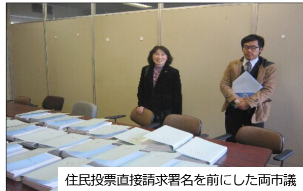
住民投票直接請求署名を前にした両市議