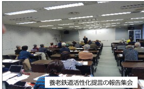
養老鉄道活性化提言の報告集会